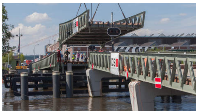
De nieuwe brug over het IJ

De nieuwe brug tussen het NDSM terrein en de Buiksloterham wordt eind augustus voor het publiek geopend. Het is een fiets/voetgangersbrug.