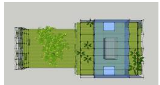
Impressie bovenaanzicht kas op het dak