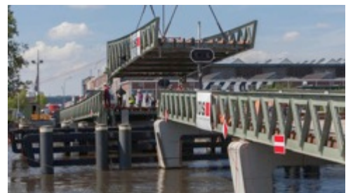
De Theo Fransman brug

Theo Fransman was de eerste stadsdeelvoorzitter van Amsterdam Noord tussen 1981 en 1990, die veel gedaan heeft om de ontwikkeling op het NDSM terrein mogelijk te maken na het sluiten van de werf.