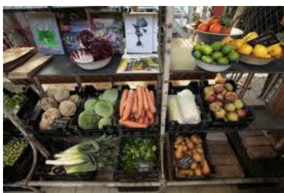
Kas Villa Augustus, Dordrecht