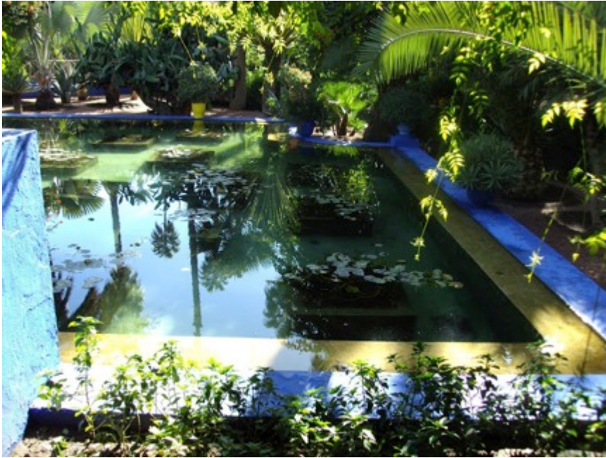
Zwembijver in de tuin van Yves Saint Laurent, Marrakesh, 2011