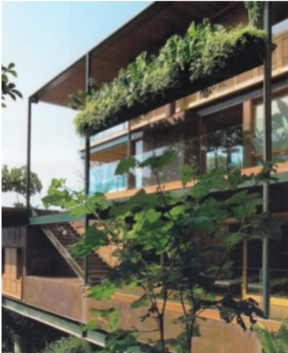
Architecture now! Houses Taschen 1 Guaruja House, Guaruja, Sao Paulo, Brazil, 2004-2006, www.bja.com.br architecten Bernandes+ Jacobsen Arquitetura